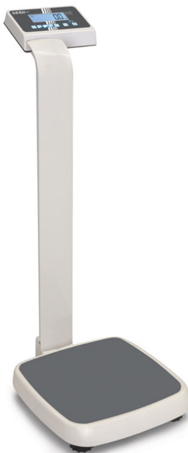
KERN MPE-P mit Stativ