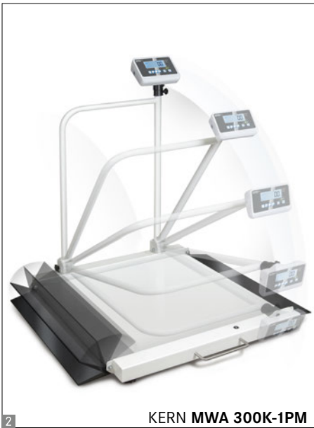
KERN MWA 300K-1PM